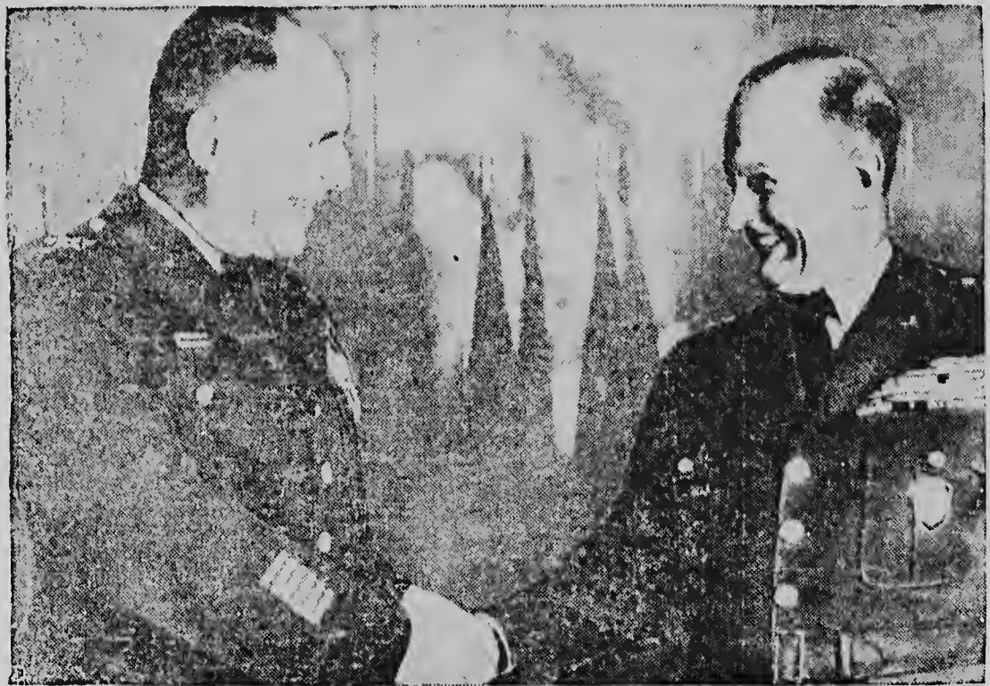
Generaal Matthew Ridgway (links), de nieuwe legerchef in het Amerikaanse college van stafchefs, en generaal Alfred Gruenther, die Ridgway opvolgt als commandant van de NATO-strijdkrachten in Europa, wensen elkaar geluk met de promoties. Gruenther is sinds het instellen van het verenigd commando in Europa en werd reeds voor Ridgway benoemd als opvolger van Eisenhower, toen deze zich terugtrok in verband met de verkiezingscampagne.